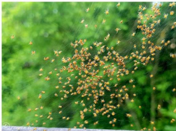
... a spider nursery