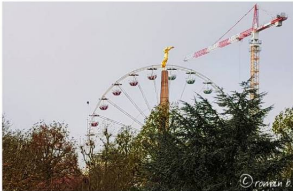
what is she up to ...