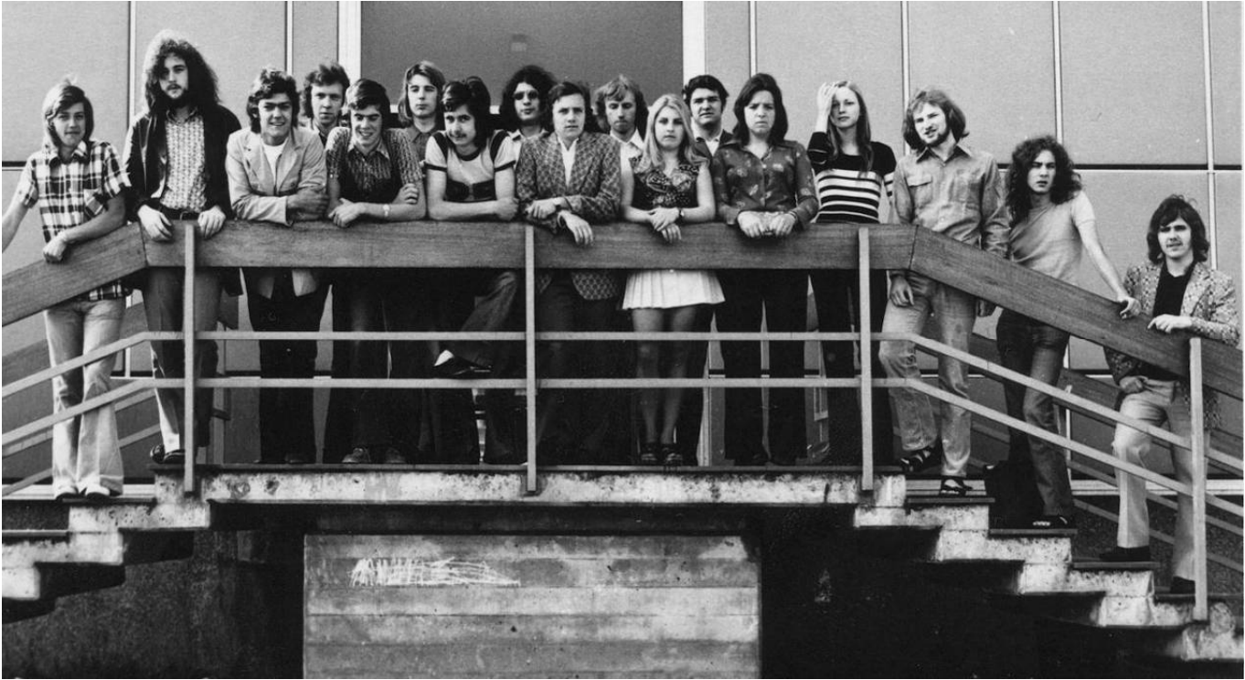
1 ère Bio-Technique 1972-1973