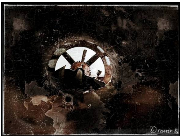
... um Wax