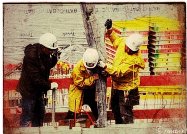
... yellow in the city