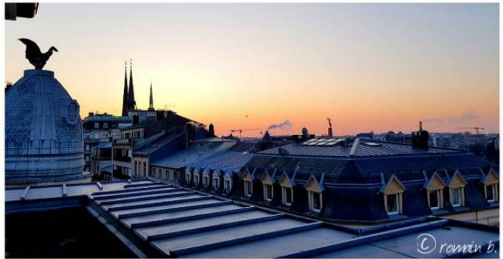
... a cold view over the roofs ...